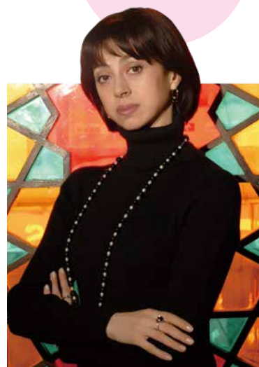
特別審査員 / ニーナ・アナニアシヴィリ